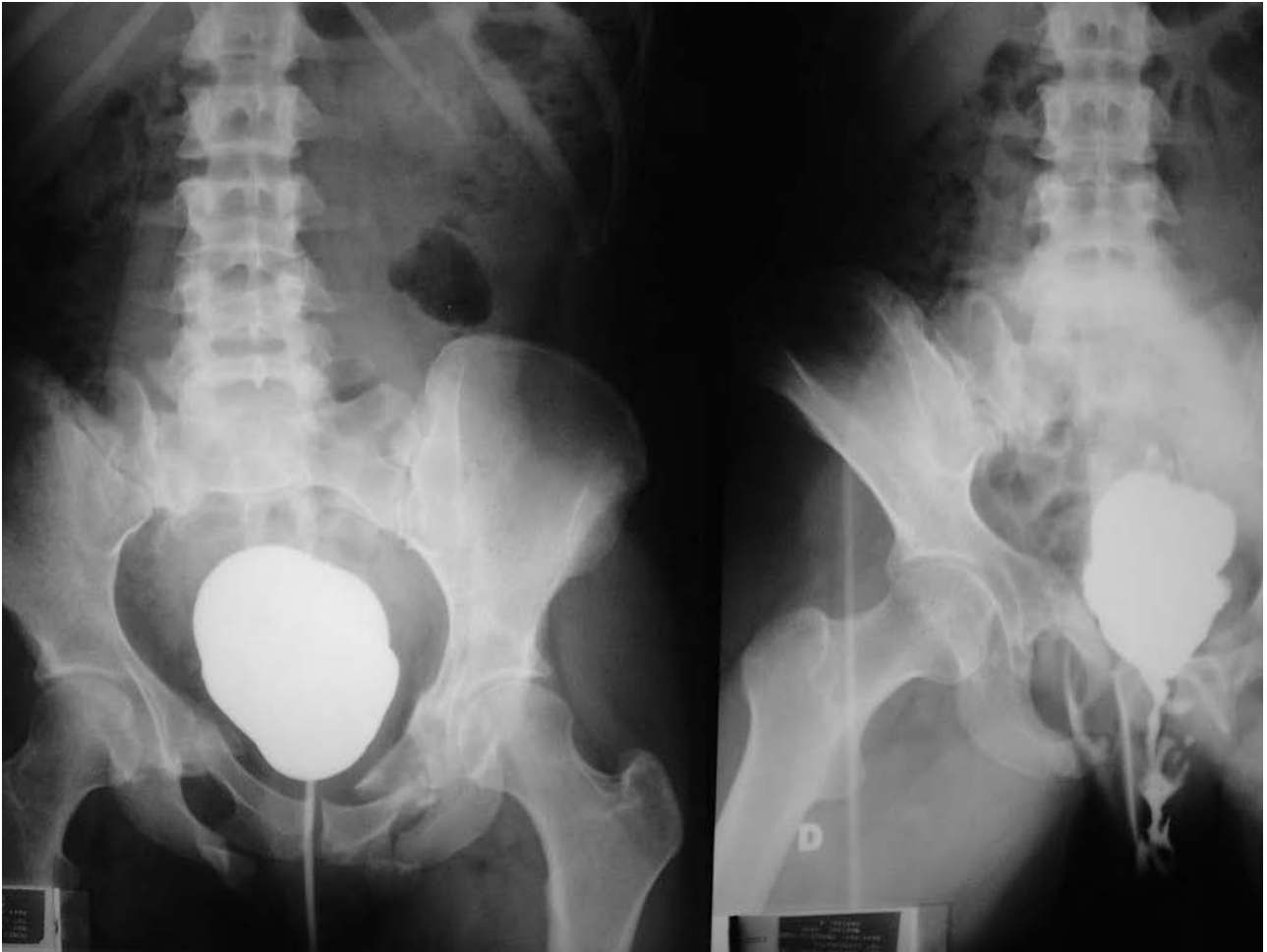
FIGURA 2. Cistografía retrógrada y miccional post-quirúrgicas. Se observa ausencia de fugas y micción espontánea.