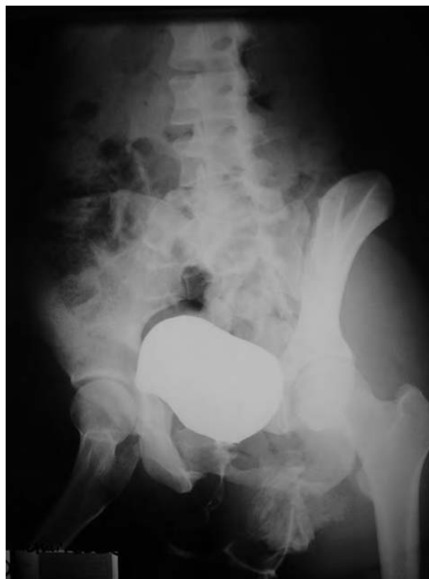
FIGURA 6. Cistografía post-intervención. No fugas de contraste. Cuello vesical íntegro.

La escasa incidencia de rotura traumática de uretra femenina se intenta explicar como debida a su escasa longitud y su importante movilidad, en contraposición a la porción membranosa de la uretra masculina, mucho más frecuentemente afectada por este tipo de traumatismos. Además su localización bajo el arco púbico le confiere cierta protección. Como mecanismo de fractura se definen varias teorías: la compresión de la uretra contra el labio postero-inferior del arco púbico durante el traumatismo y el retroceso de este último causaría avulsión de la uretra 1,2 , la compresión lateral del anillo pélvico que resulta en un aumento de la distancia anteroposterior. La vejiga es elevada causando estiramiento y posterior