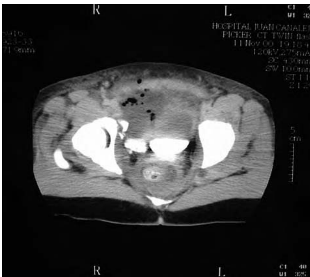
FIGURA 3. TAC: extravasación de contraste en pelvis. Rotura de vejiga y desinserción uretral.

Cistografía de control: fuga de contraste en cuello vesical.