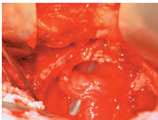
FIGURAS 4 y 5. Rotura vesical de cuello y uretra durante intervención.

Última consulta, 11-12-02: tras año y medio de seguimiento la paciente presenta una cistografía normal (Fig. 6). Un estudio urodinámico con flujo máximo de 15,6 y residuo de 47 cc. No presenta incontinencia ni con esfuerzos. Continencia hasta 4-5 horas. A veces mínima pérdida que trata con salva-slip.