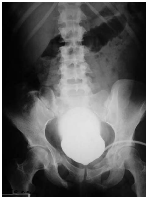
FIGURA 1. Cistografía por talla vesical. Se observa cuello vesical cerrado y ausencia de micción.

1ª revisión: 3 meses tras intervención quirúrgica: no presenta incontinencia pero la flujometría es obstructiva, con flujo máximo de 3,4 ml/sg y el residuo escaso (20 cc). Se indica protocolo de dilataciones uretrales (Fig. 2).