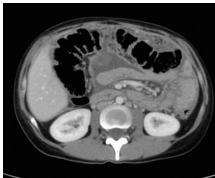
Figura 3 TC abdominal con contraste intravenoso, epigastrio.