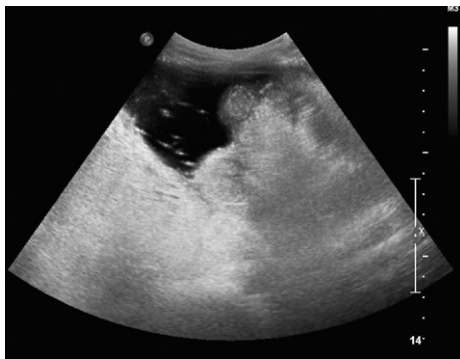
Figura 1 Ecografía de abdomen, zona de flanco derecho.

Recibido el 24 de marzo de 2009; aceptado el 29 de septiembre de 2009