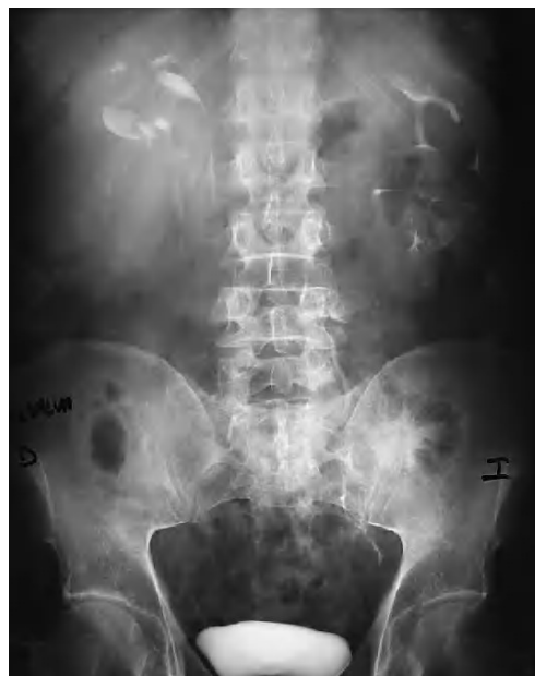
Fig. 2.—Urografía intravenosa.