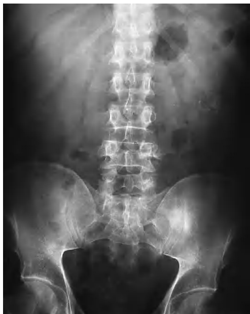
Fig. 1.—Radiografía simple.

Servicio de Radiodiagnóstico. Hospital de la Princesa. Madrid. España.