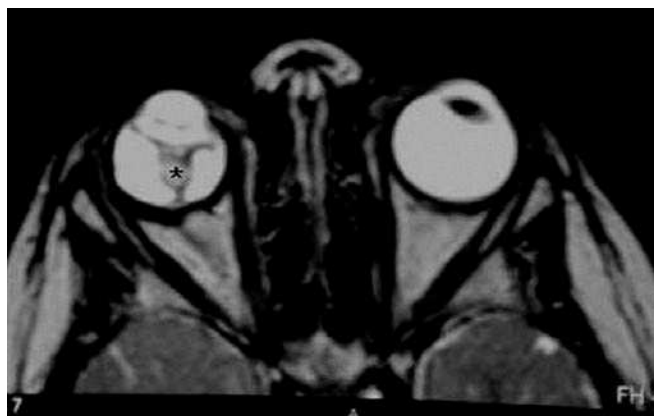
Fig. 2.—RM de órbitas. Secuencia axial T2.