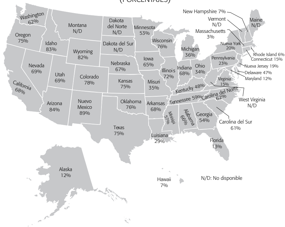
Mapa 1 INMIGRANTES MEXICANOS INDOCUMENTADOS POR ESTADO (2012) (PORCENTAJES)

Nota: Porcentajes calculados con números sin redondear.