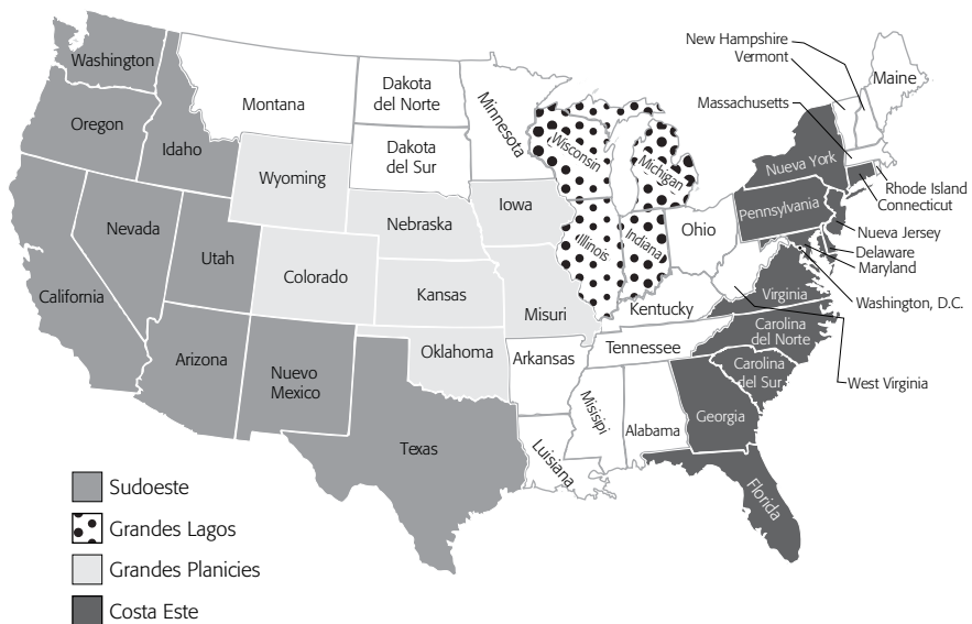
Mapa 2 REGIONES DE DESTINO DE LA MIGRACIÓN A ESTADOS UNIDOS

El autor ilustra su regionalización en el mapa 2, que aparece a continuación.