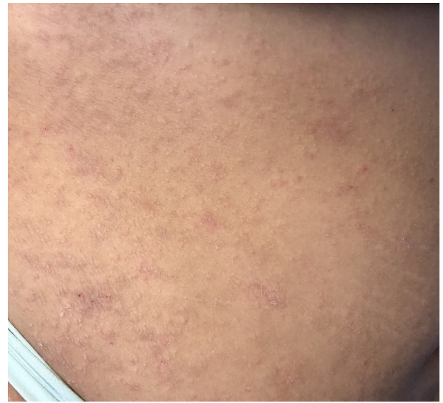
Figura 2 Detalle de las lesiones presentes en el flanco de la paciente. Se puede observar con claridad la coloración blanquecina y brillante de las placas, con presencia de estriado en las mismas. Este aspecto es característico de las lesiones liquenoides.

Se ha contado con el consentimiento del paciente y se han seguido los protocolos del centro de trabajo sobre el tratamiento de la información de los pacientes.