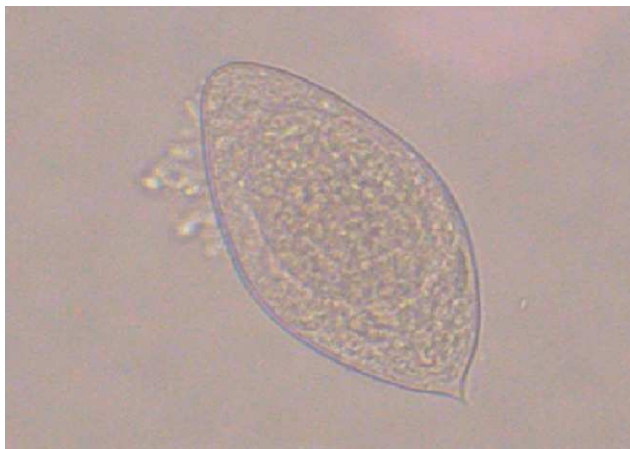
Figura 3 Huevo de Schistosoma haematobium con su típico espolón terminal.

En el hemograma no existían datos de interés (hemoglobina 12,8 g/dl, hematocrito 37,2%, volumen corpuscular medio de 82,9 fl y eosinófilos 6,2%). La bioquímica fue normal (hierro 71 µg/dl y ferritina 63 ng/ml), descartándose anemia ferropénica. El examen sistemático de orina mostró hematuria (>100 hematíes/campo), leucocituria (20–20 leucocitos/campo), ligera proteinuria y presencia de parásitos.