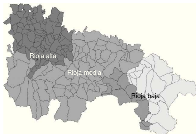
Figura 1 Distribución de la áreas geográficas de la Rioja (rojo, verde y amarillo corresponde al valle riojano y marrón, naranja y gris a la sierra riojana). Zonas más pobladas son el valle de la Rioja media y Rioja baja.

El aumento de inmigrantes procedentes de estas zonas endémicas africanas, conlleva la necesidad de considerar la esquistosomiasis en el diagnóstico diferencial de la