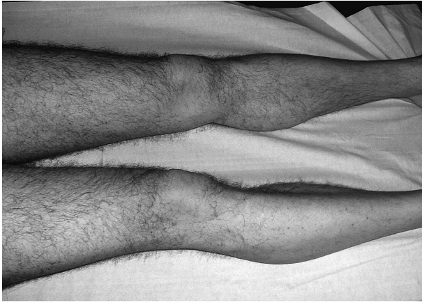
Figura 1. Púrpura de Henoch-Schönlein. Lesiones purpúricas en miembros inferiores