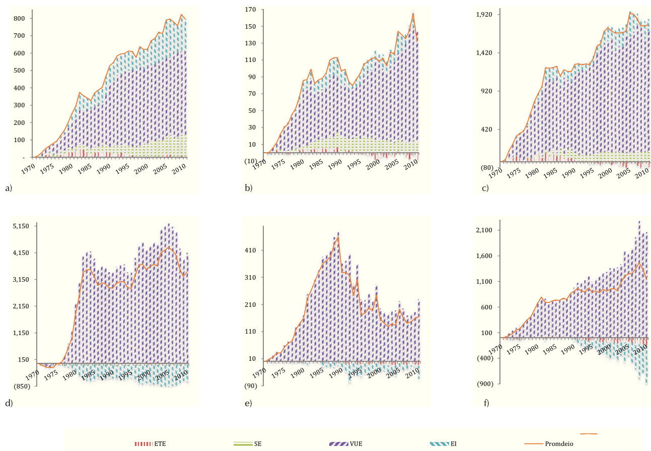
Figura 3. Distribución de efectos que explican el consumo de energía (PJ), a) residencial, b) agropecuario, c) sectores económicos, d) exportaciones de energía, e) sectores de consumo no energético, f) transporte

energía no asimilada tiene efectos negativos en los demás sectores, si plantean un crecimiento en su producción estos no tendrán energía para sustentarlo, las opciones que tiene son diversificar sus fuentes e importar energía, lo que conlleva al aumento de sus costos de producción. Por lo tanto, se concluye que la salida de esa cantidad de energía resta capacidades de aumentar el efecto actividad en los sectores más dependientes de los hidrocarburos.