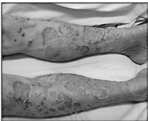
Figura 3. Placas eritematosas infiltrativas de bordes definidos en los miembros inferiores.

Recibió manejo con corticoesteroides tópicos de gran potencia y 7,5 mg semanales de metotrexato, por el extenso compromiso de las lesiones. Se inició tratamiento antirretroviral con zidovudina más lamivudina; sin embargo, por la pancitopenia que presentaba, la zidovudina tuvo que cambiarse por abacavir. A las dos semanas de inicio del tratamiento las lesiones empezaron a remitir y a las ocho semanas el paciente presentaba resolución casi completa de las lesiones. Fue evaluado con el índice PASI (Psoriasis Area and Severity Index), y se obtuvo un puntaje de 11. No se presentó ningún efecto secundario con la administración de metotrexato.