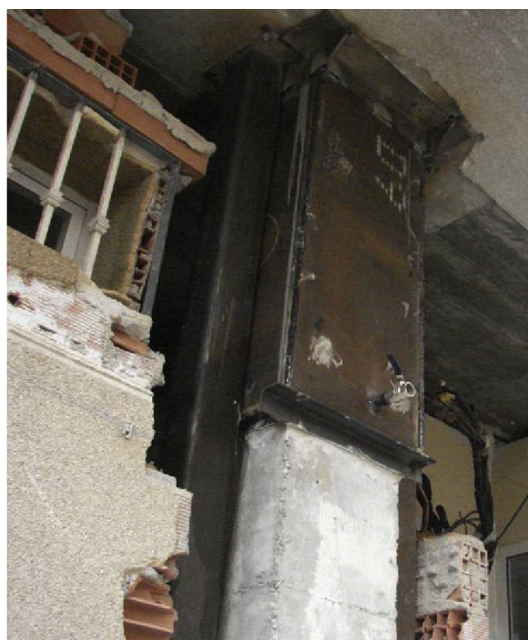
Figura 5. Actuaciones en cabeza de soportes (fotos tomadas en Lorca).