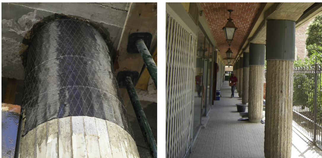
Figura 6. Pilares sin tratamiento del soporte (refuerzos ejecutados tras el sismo en Lorca).