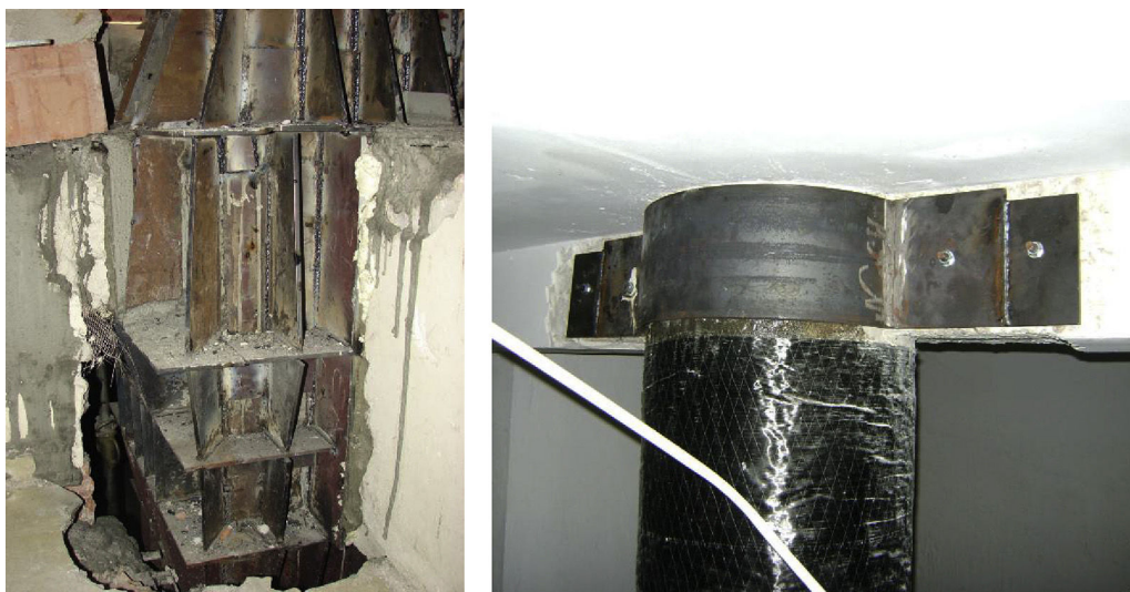
Figura 2. Ejemplos de actuaciones en nudos para encamisado y zunchado de pilares (fotos tomadas en Lorca).