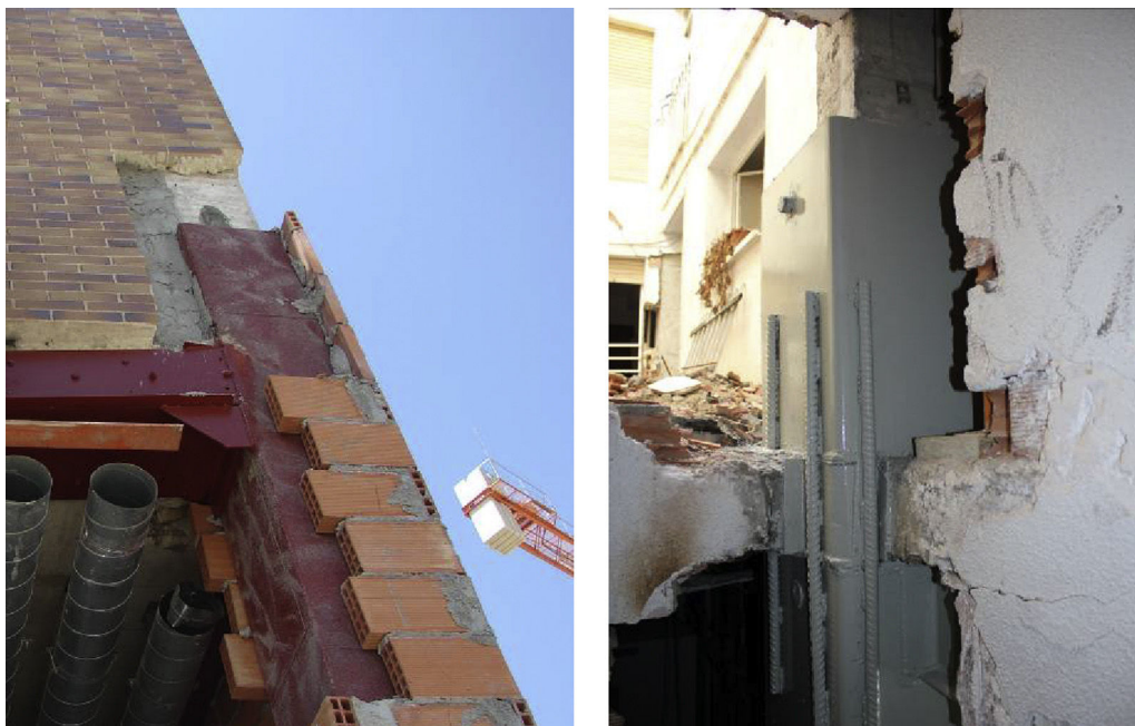
Figura 11. Ejemplos de transmisión de cargas (refuerzos ejecutados tras el sismo en Lorca).