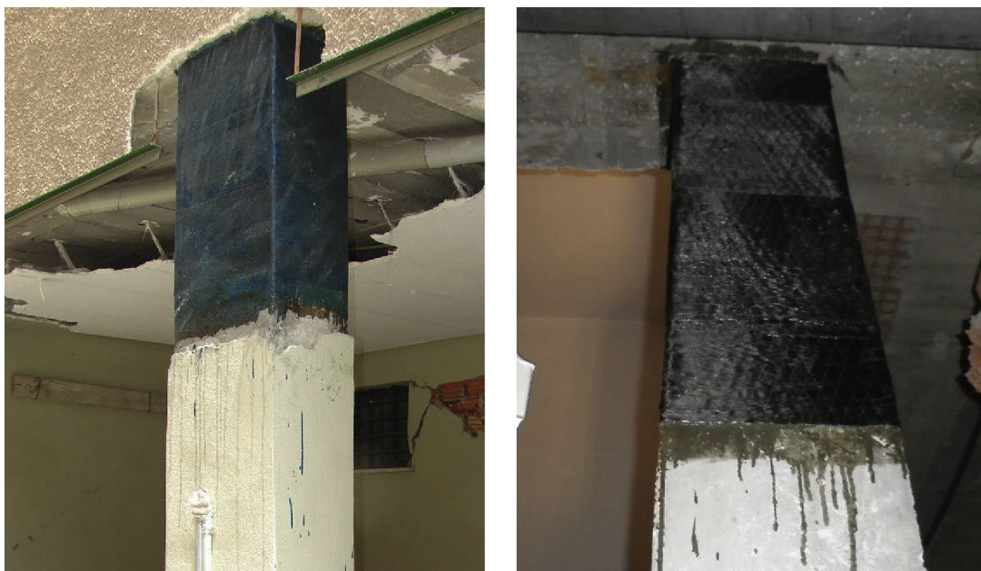
Figura 9. Refuerzos en los que no se respetan las indicaciones en relación con el tratamiento de la superficie y redondeo de esquinas (refuerzos ejecutados tras el sismo en Lorca).

Además, como las resinas pierden parte de sus características resistentes a partir de valores de temperatura inferiores a 60^{\circ}\text{C} , en el caso de refuerzos que puedan estar sometidos al soleamiento, y dado que en la mayoría de los casos el material es de color negro, se ha de tomar la precaución de evitar que puedan alcanzar dicha temperatura, en algunos casos simplemente revistiéndolos con un acabado de color blanco.