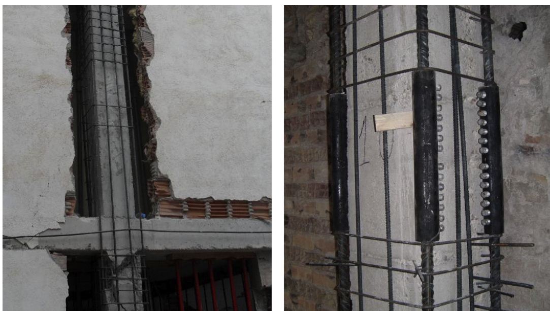
Figura 12. Continuidad de la armadura (refuerzos ejecutados tras el sismo en Lorca).

actuar sobre las plantas superiores, con la longitud de transferencia necesaria en cada caso, si la transmisión es por tensiones tangenciales.