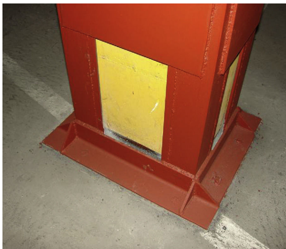
Figura 4. Apoyo de refuerzo sobre solera (foto tomada en Lorca).

ser necesarias para garantizar la estabilidad del refuerzo, deberán quedar definidas en el Proyecto.