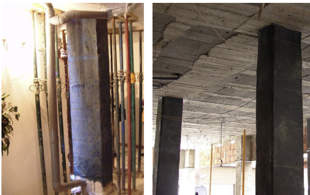
Figura 7. Pilares sin tratamiento del soporte (refuerzos ejecutados tras el sismo en Lorca).

del hormigón a considerar a partir de la armadura de confinamiento, la cuantía mecánica volumétrica de confinamiento, así como un factor, \alpha , que tiene en cuenta la separación entre cercos, el tipo de hormigón y la efectividad de la armadura transversal dispuesta. Esta armadura transversal es la «responsable» de la mejora en la resistencia del soporte, por lo que su diámetro (8 mm mínimo), así como las condiciones de anclaje y solape de la misma (estribos cerrados terminados en ganchos de por lo menos 135^\circ , por ejemplo), son determinantes para asegurar el correcto funcionamiento del refuerzo.