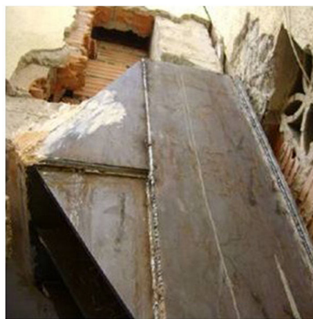
Figura 10. Detalle de refuerzo de capitel [8].

En la mayoría de los casos, para la entrada en carga del «nuevo» pilar, no es suficiente con la disposición de capiteles, sino que es necesario movilizar la transmisión de esfuerzos desde las plantas superiores a través del mecanismo de adherencia entre los distintos tramos de soporte y refuerzo. En estas circunstancias, en todos los tramos a través de distintas plantas se ha de asegurar el contacto, así como se ha de asegurar la transmisión en el nudo, lo cual conlleva ejecuciones complicadas en la mayoría de los casos (Fig. 11).