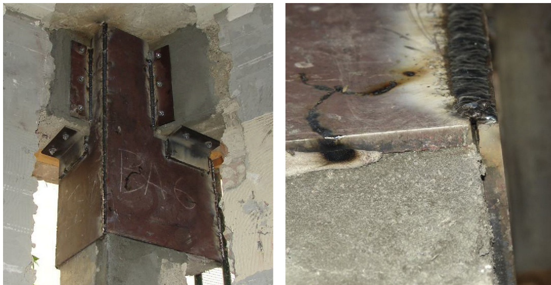
Figura 8. Detalles incorrectos en zunchado de pilares (refuerzos ejecutados tras el sismo en Lorca).