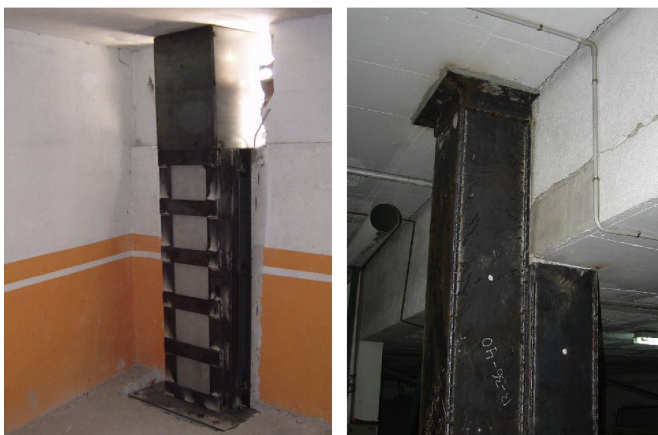
Figura 3. Zunchado y empresillado parcial sobre tramo de pilar dañado (fotos tomadas en Lorca).

Se han de definir las acciones frente a las cuales se ha previsto reforzar y, aunque los refuerzos frente a cargas verticales son los más habituales, en ocasiones será necesario reforzar frente a acciones horizontales, o mejorar su ductilidad y/o capacidad a flexión. En cualquier caso, se ha de evaluar la afección del refuerzo frente al resto de acciones para las que no se ha definido. Además, la nueva rigidez y ductilidad del soporte reforzado influirá en el resto de elementos de la estructura, incluso en los que no se haya intervenido, en especial con relación al reparto de cargas entre ellos a partir de la ejecución del refuerzo, y en especial frente a sismo.