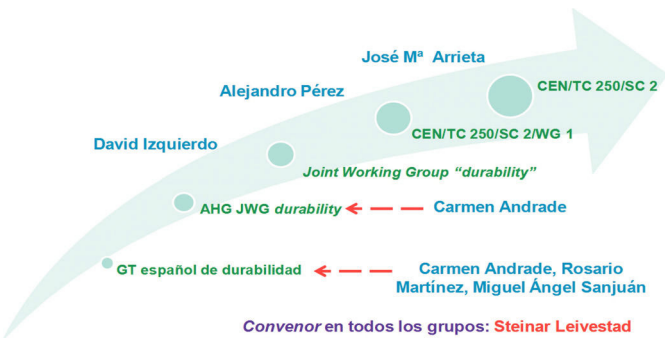
Figura 1. Estructura de los grupos de trabajo implicados en la revisión del Eurocódigo 2 desde el punto de vista de la durabilidad. Los representantes españoles en cada grupo aparecen en azul.

Para clasificar por durabilidad, por el momento, el JWG TC-250/TC-104 - durability sólo considera el nivel 2 basado en el ensayo directo de la resistencia a la corrosión como la mejor estrategia para el diseño de un hormigón durable [7] y pretende redactar unos nuevos ensayos de resistencia a la carbonatación y a los cloruros diferentes ligeramente de los ya aprobados [4,5] y sometidos a ensayos ineterlaboratorios a nivel europeo. La tabla 2 muestra cómo la norma EN 206-1 podría presentar las clases de durabilidad y las composiciones determinadas experimentalmente para cumplir con las prestaciones definidas. En la tabla, las definiciones de RC20, RC30 y RC40 se refieren a resistencia a la carbonatación equivalente a una penetración del hormigón carbonatado menor de 20, 30 o 40 mm a los 50 años y lo mismo para los cloruros cuya denominación RSD significa “resistance to sea water and deicing salts” (resistencia al agua de mar y sales de deshielo). Asimismo, el JWG TC-250/TC-104 - durability sugiere que estas resistencias se pueden relacionar con distintas composiciones del hormigón que se deberían actualizar periódicamente en función del desarrollo de nuevos materiales, de nuevas tecnologías o del estado del conocimiento.