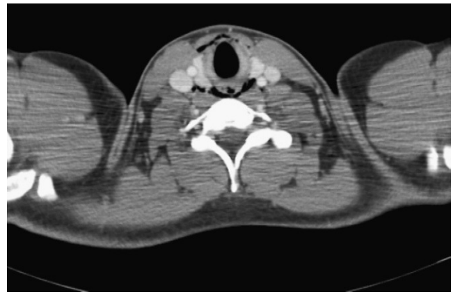
Figura 2 TC cervicotorácica. Enfisema en cuello.

exámenes complementarios con radiografía simple de tórax y tomografía computarizada (TC) cervicotorácica con contraste intravenoso encontrando aire extraluminal correspondiente a neumomediastino y enfisema en cuello (figs. 2 y 3).