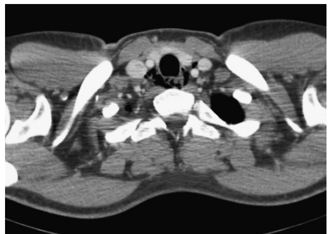
Figura 3 TC cervicotorácica. Neumomediastino.

El examen histológico de las biopsias esofágicas reveló la existencia de un infiltrado eosinófilo (> 40 eosinófilos por campo de gran aumento) en la mucosa esofágica junto con microabscesos compatible con esofagitis eosinofílica, por lo que se indicó tratamiento domiciliario con fluticasona inhalada 250 µg/12 h. En controles posteriores en consulta externa el paciente permanece asintomático, sin nuevas crisis de impactación alimentaria ni disfagia.