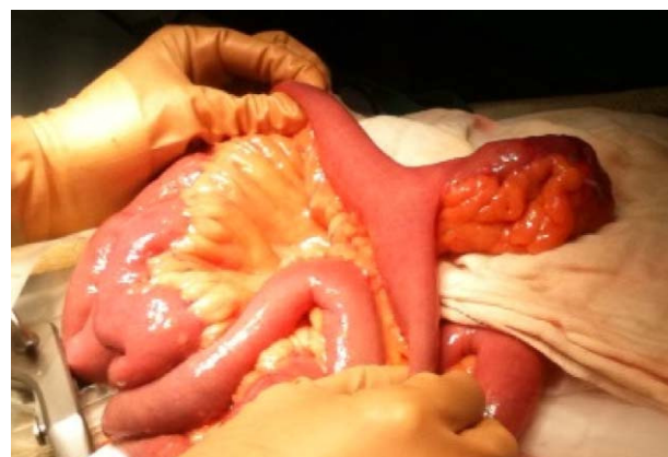
Figura 3 Formación diverticular a nivel de asa de íleon con datos de inflamación y perforación.

Tras la intervención quirúrgica el paciente presentó cuadro de insuficiencia respiratoria que finalmente evolucionó favorablemente sin necesidad de ventilación mecánica. A los 4 días de la intervención presentó evisceración contenida por lo que finalmente, y tras optimizar en lo posible la situación respiratoria del paciente, se reintervino para nuevo cierre de la laparotomía (bajo anestesia raquídea). Posteriormente el paciente evolucionó de forma lentamente favorable, siendo finalmente dado de alta hospitalaria en el día 18 tras la cirugía.