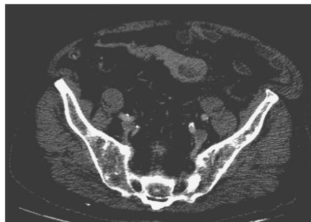
Figura 2 TC abdominal, corte axial. Dilatación de segmento ileal con engrosamiento irregular de su pared e infiltración de la grasa mesentérica circundante.

Con todos estos hallazgos se decidió intervención urgente mediante laparoscopia que identificó plastrón de sigma y asas de delgado con líquido purulento en vecindad. Por dificultades técnicas se convirtió a laparotomía, identificándose como origen del proceso inflamatorio un gran divertículo del íleon (a aproximadamente 80 cm de la válvula ileocecal), con base en su borde antimesentérico. El divertículo presentaba datos evidentes de inflamación y perforación (fig. 3).