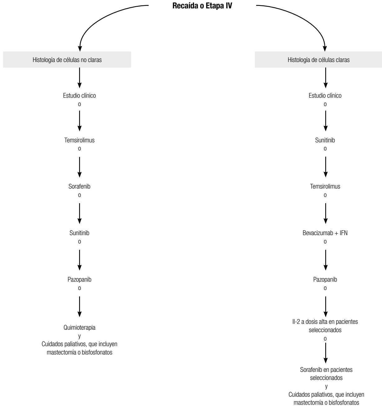
Figura 1. Tratamiento de primera línea.

Adaptado de: Lineamientos de la NCCN para la Práctica OncológicaTM. Cáncer Renal V.2.2011