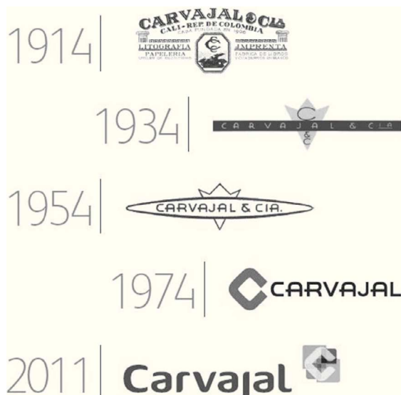
Figura 1. Imagen de Carvajal a través del tiempo.

tomando 2 colores: azul índigo y gris. Asimismo, y consecuente con su historia, 2 décadas después nuevamente renueva su marca, definiendo su logo en color azul enmarcado en una elipse. Como era de esperar, 20 años más adelante, en 1974, Carvajal renueva su logotipo aprovechando también su reciente cambio de razón social, que había ocurrido en 1970. Fue entonces cuando se cambió su razón social, existente desde 1907, de Carvajal & Cía. a Carvajal S.A., y se definió como marca el logotipo en fuente Carfont, de color negro y la letra «C» en forma de rombo en azul Carvajal. Este año también se creó el eslogan «Carvajal hace las cosas bien», el cual buscaba resumir la promesa de valor de Carvajal hacia sus clientes.