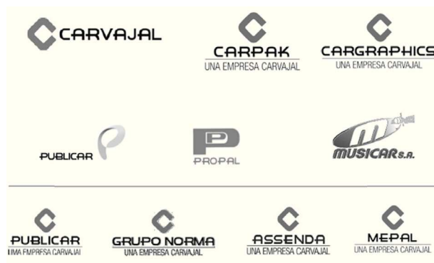
Figura 2. Arquitectura de marca Carvajal, 2009.

De esta forma se instituyeron 13 razones sociales independientes para operar cada una con su propia estructura: presupuesto, gobierno, fuerza comercial, equipo de colaboradores e imagen comercial. Las empresas que se establecieron fueron: Bico Internacional S.A., Fesa S.A., Publicar S.A., Cargraphics S.A., Carpak S.A., Grupo Editorial Norma S.A., Integrar S.A., Mepal S.A., Escarsa S.A., IBC Solutions S.A., Musicar S.A., GC2 Carvajal S.A. y Propal S.A., esta última siendo la más reciente adquisición de la compañía en 2004: «Con el propósito de afianzar sus operaciones en Colombia y fortalecerse para competir en los mercados internacionales, Carvajal decidió ampliar su participación accionaria en Propal y tomar el control de la compañía» (El Tiempo, 2004). De este modo se vio en la necesidad de establecer un logotipo para cada una de sus compañías. La figura 2 representa la arquitectura de marca Carvajal en 2009, cuando se había consolidado la integración entre negocios similares entre sí: Bico Internacional y Editorial Norma, bajo el