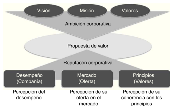
Figura 3. Propuesta de valor.