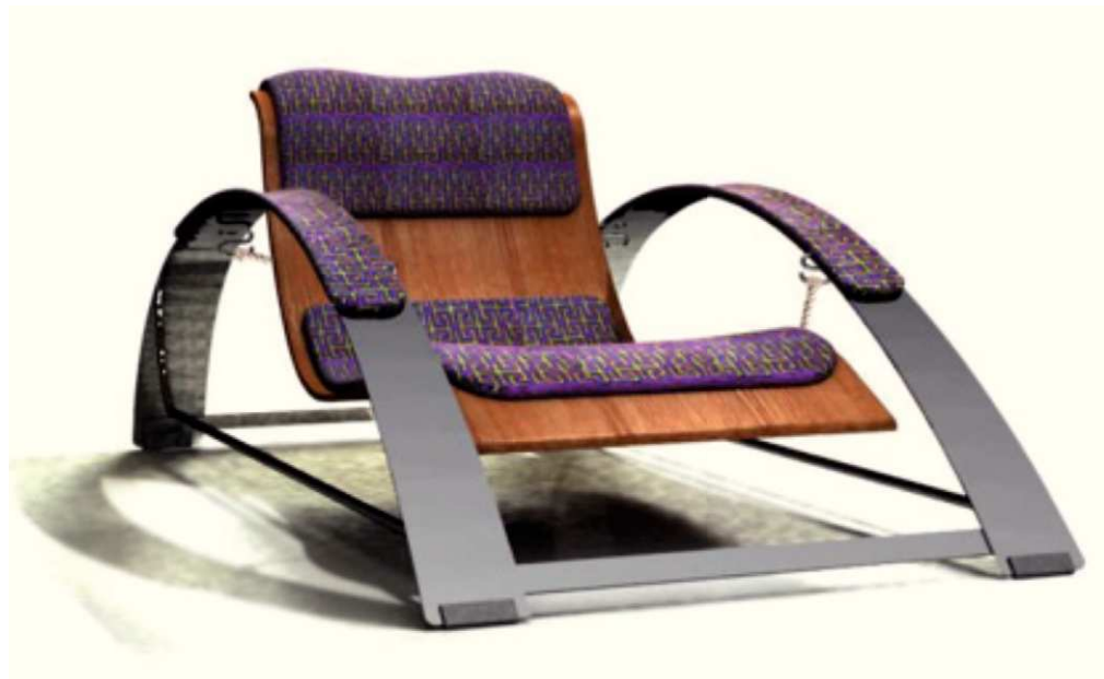
Gráfico A1. Imagen que representa el estado del arte en la tendencia (G) local