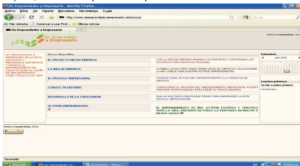
Gráfico A3. Cursos “De emprendedor a empresario”