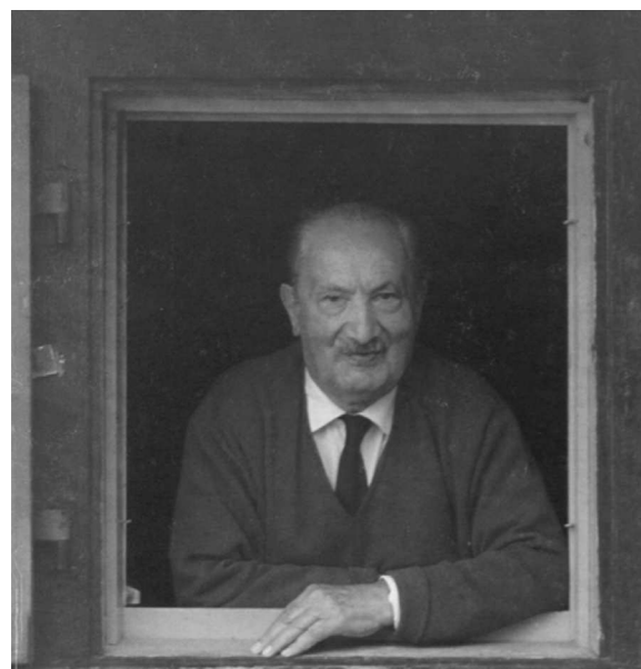
Figura 1 Martín Heidegger.

Existía el movimiento de los «viejos católicos», que tenían sus raíces sociales sobre todo entre la burguesía