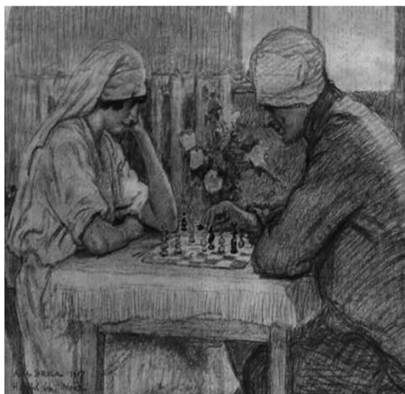
Figura 2 «Enfermera jugando al ajedrez con un soldado herido» obra del pintor francés Alexis Louis de Broca realizada en 1917.

En efecto, la muerte es un fenómeno de la vida, esto implica asumir la existencia misma, así la conciencia puede llamar libertad ante la muerte que consiste en preguntarse. ¿Qué hacer con la muerte y con qué profundidad vivirla? Y en consecuencia ¿Qué hacer con la vida? 13 .