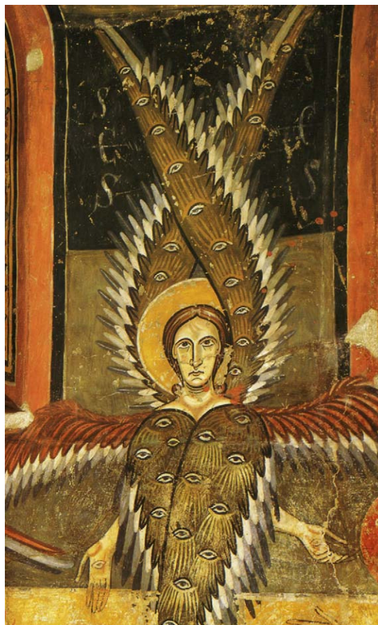
Fig. 4 – Serafín del ábside central de Santa María d'Aneu.