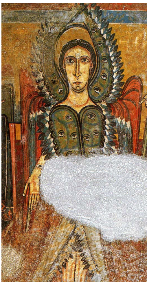
Fig. 3 – Serafín del arco presbiterial de Santa María de Taüll.