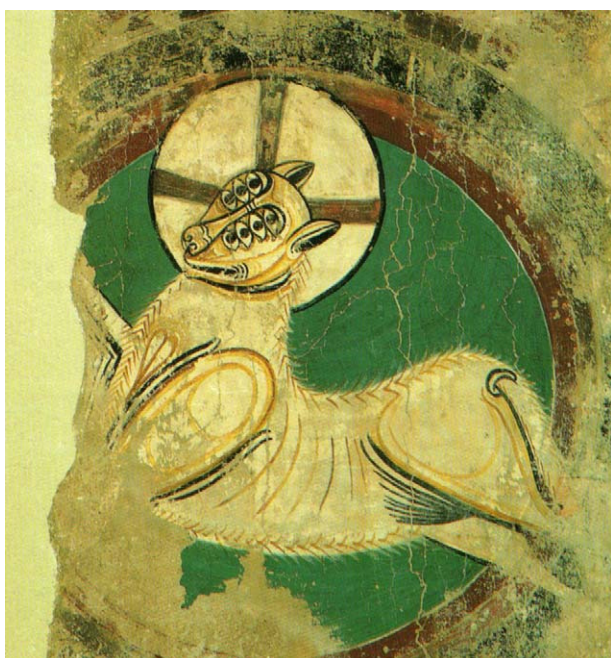
Fig. 1 – Agnus Dei, ábside central de Sant Climent de Taüll.

Los dos grandes conjuntos de pintura mural del arte románico en España se encuentran en las iglesias de Sant Climent de Taüll y de Santa María de Taüll (Vall d'Aran, Lérida), ambas consagradas en 1123. En Sant Climent dos serafines con ojos en las alas están al lado de la figura imponente de Cristo en majestad; también se puede apreciar el cordero de 7 ojos ( Agnus Dei ) (fig. 1), símbolo de Cristo, situado en la clave del arco y dos animales del tetramorfos, el toro y el león, con el cuerpo cubierto de ojos (fig. 2). En Santa María, el ábside central está presidido por la imagen de la Virgen y el niño y solo se conserva uno de los serafines que la flanqueaban (fig. 3). Se encuentran también serafines con ojos en las alas en los ábsides de Santa María d'Aneu (Pallars Sobirà) (fig. 4), de Sant Pau d'Estèrri de Cardós y de Santa Eulalia de Estaón 2 .