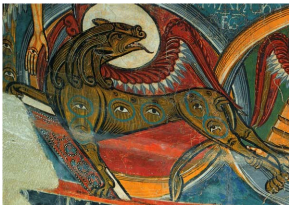
Fig. 2 – Tetramorfos (un león), ábside central de Sant Climent de Taüll.