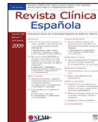
IMAGEN DEL MES