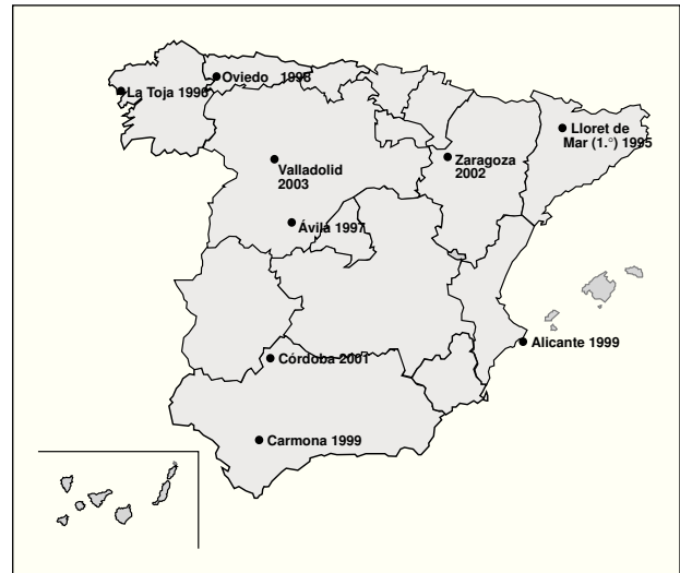
Fig.1. Distribución geográfica de los cursos de posgrado de nutrición de la SEEN.

El desarrollo de las guías de práctica clínica (GPC) es fruto de la colaboración de la SEEN y Glaxo-Wellcome, y además han participado diversas sociedades científicomédicas. El objetivo fundamental de esta iniciativa es desarrollar una herramienta útil para la formación continuada de los especialistas en endocrinología y nutrición. Los avances científicos en alimentación y nutrición se han producido muy rápidamente, tanto en clínica como en investigación básica. El soporte informático y la distribución a través de la red facilitan, sin duda, la difusión de conocimientos en nutrición, así como sus implicaciones en la prevención y el tratamiento de algunas enfermedades.