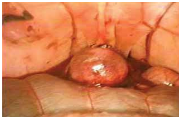
FIGURA 1. Divertículo vesical creado.

sentaron dos lesiones intraoperatorias de mucosa vesical que fueron reparadas de manera inmediata con sutura laparoscópica intracorpórea.