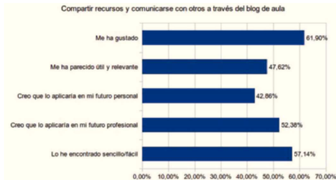
Figura 2. Gráfico de la valoración final del blog en los cuestionarios de alumnos.

Los cuestionarios finales tenían como objetivo averiguar el grado de aceptación, utilidad, posibilidad de transferencia personal y profesional y sencillez de uso del blog por parte de los alumnos, para validar la estrategia didáctica de integración del uso del blog en la asignatura. El cuestionario se diseñó a partir de una versión validada por expertos previa-