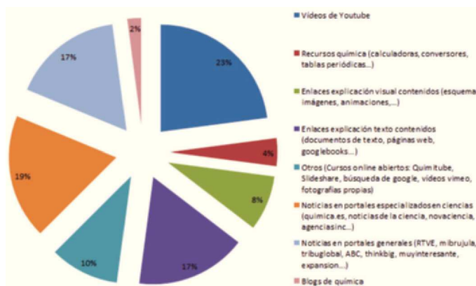
Figura 3. Tipos de contenido compartido en el blog.

buena idea para disponer de un sitio donde compartir y fomentar el interés por la asignatura y la química, al mismo tiempo que ayuda a la formación, permitiendo ver otra dimensión de la química aparte de la teoría (el mundo que rodea la química, trascendencia en la vida real, forma distinta de ampliación de conocimientos...). Además, su uso no es complicado y permite participar de forma sencilla a todos.