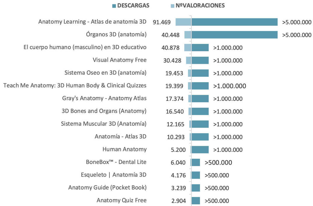
Figura 2 Ranking de las 15 aplicaciones más populares del mercado actual.