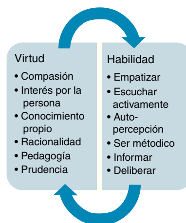
Figura 2 Relación bidireccional entre las virtudes del carácter y las habilidades.

Ese «tirar» también exige darse a sí mismo consignas con las que trabajar día tras día. Como la consigna del estudiante de un instrumento de música, que se propone la máxima expresividad conforme al estilo de la partitura bajo su interpretación. Por ejemplo, en una consulta desbordada de pacientes, quizá con un cansancio acumulado al final de una larga jornada y tras una semana con guardias, tirar de sí mismo hacia la hospitalidad es una forma de ser que se traduce en mínimos gestos que, sin embargo, tienen un