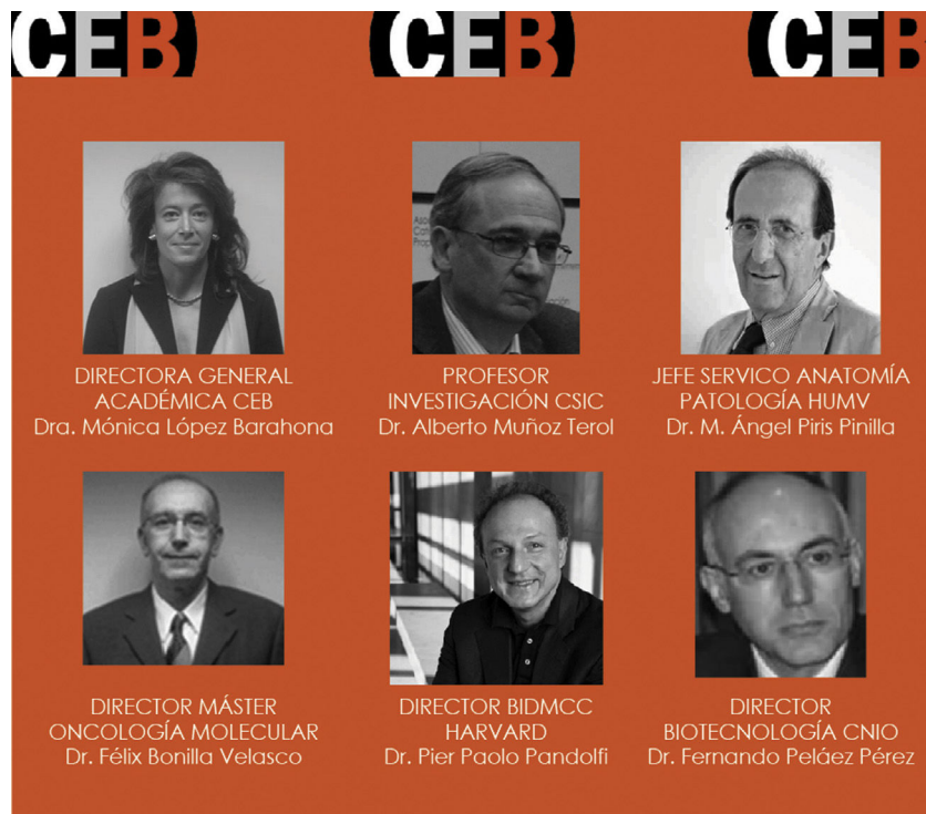
Figura 2 Dirección general académica del Máster en Oncología Molecular: Bases Moleculares del Cáncer.