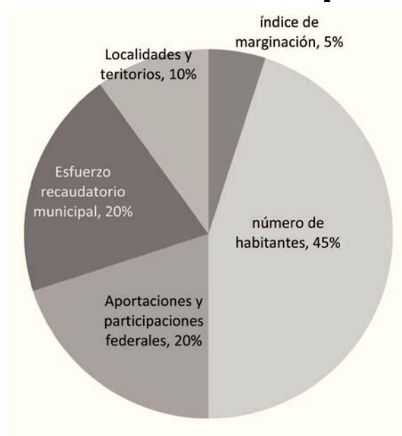
Gráfica 1 Criterios de distribución del Fondo Municipal de Participaciones