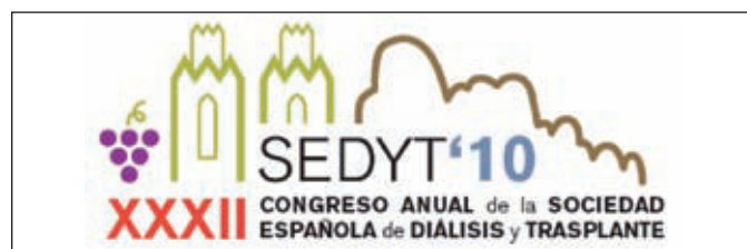
Figura 2. Logotipo del Congreso.

No es fácil superar el nivel de calidad y ciencia que los anteriores congresos han tenido, pero no dudéis que como mínimo intentaremos igualarlo con un programa que sea actual y científicamente de nivel. Asimismo, esperamos que suscite el interés de todos los que podáis asistir para que sea útil para el trabajo diario que todos desempeñamos y para el cual necesitamos aportar continuamente las novedades y actualizaciones de nuestra especialidad con el fin de mantener nuestra competencia profesional.