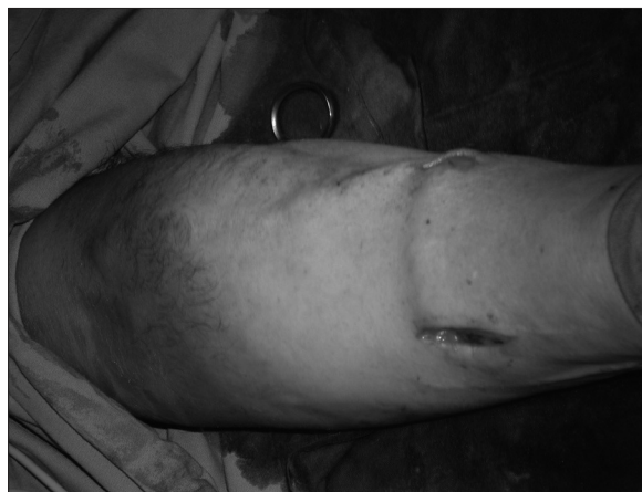
Figura 2. Trombosis de vena cefálica. Uso de vena criopreservada para unir arteria radial y vena dorsal.