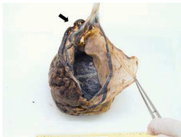
Fig. 2. Aspecto macroscópico de placenta y cordón umbilical. Se muestra la inserción velamentosa del cordón umbilical con un vaso venoso totalmente lacerado por fuera de la gelatina de Wharton.

Estudios previos han señalado la presencia de diversos factores de riesgo asociados a la aparición de vasa previa, tales como: gestación tras fecundación in