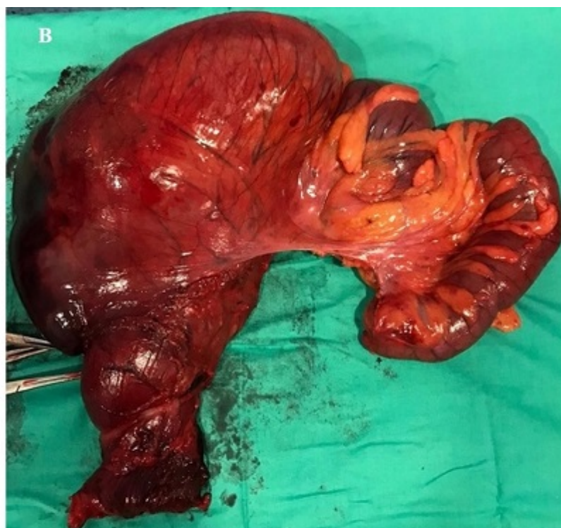
Imagen 1. Dilatación de sigma junto a gran hematoma intramural contenido.

A, imagen intraoperatoria. B, pieza quirúrgica tras sigmoidectomía.