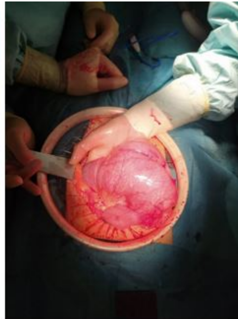
Figura 2: dilatación secundaria a invasión intestinal (segunda reintervención)