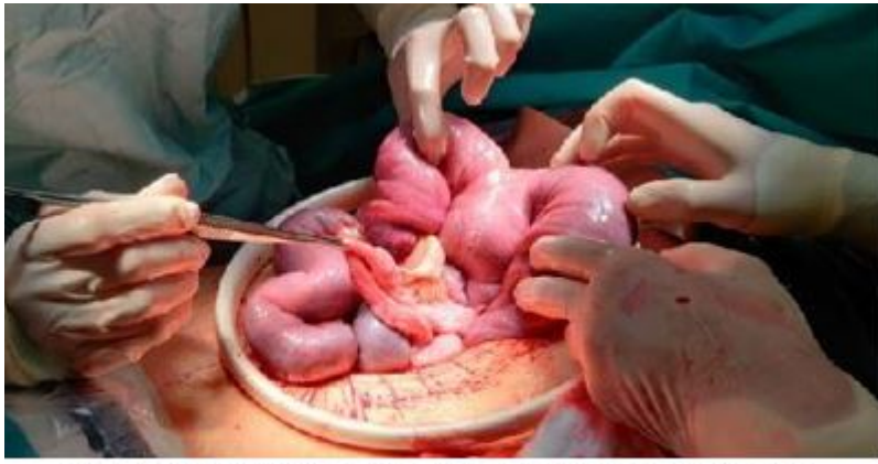
Figura 1: Invasión intestinal (primera reintervención)