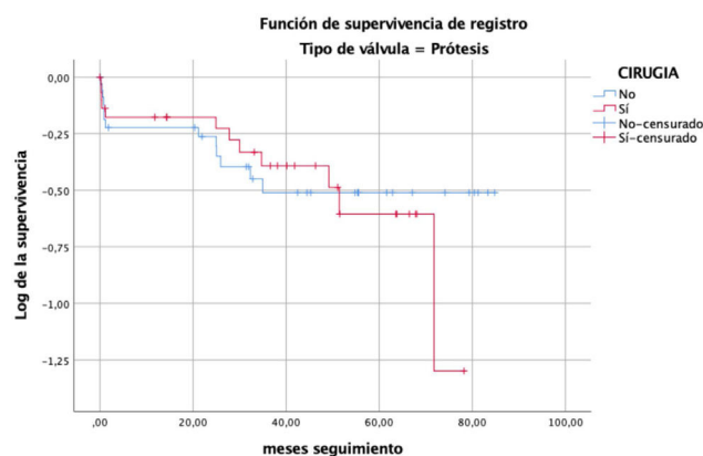
TIPO DE VÁLVULA