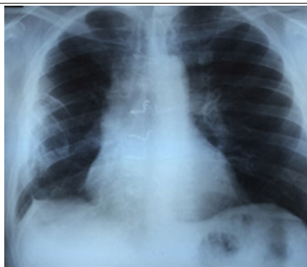
Figura 1. Radiografía PA de tórax que muestra rotura de grapas de nitinol.

b Servicio de Cirugía Cardíaca, Hospital Puerta del Mar, Cádiz, España