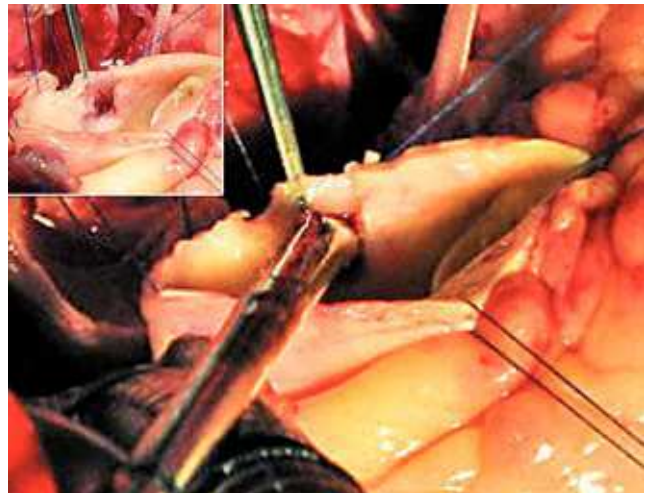
Figura 2. Plastia finalizada mostrando el diámetro del nuevo ostium.

Correspondencia: Ricardo E. Gallo Cardiac Services Directorate Armed Forces Hospital SR PO Box 101 Khamis Mushayt (Saudi Arabia) E-mail: ric_gallo@yahoo.com