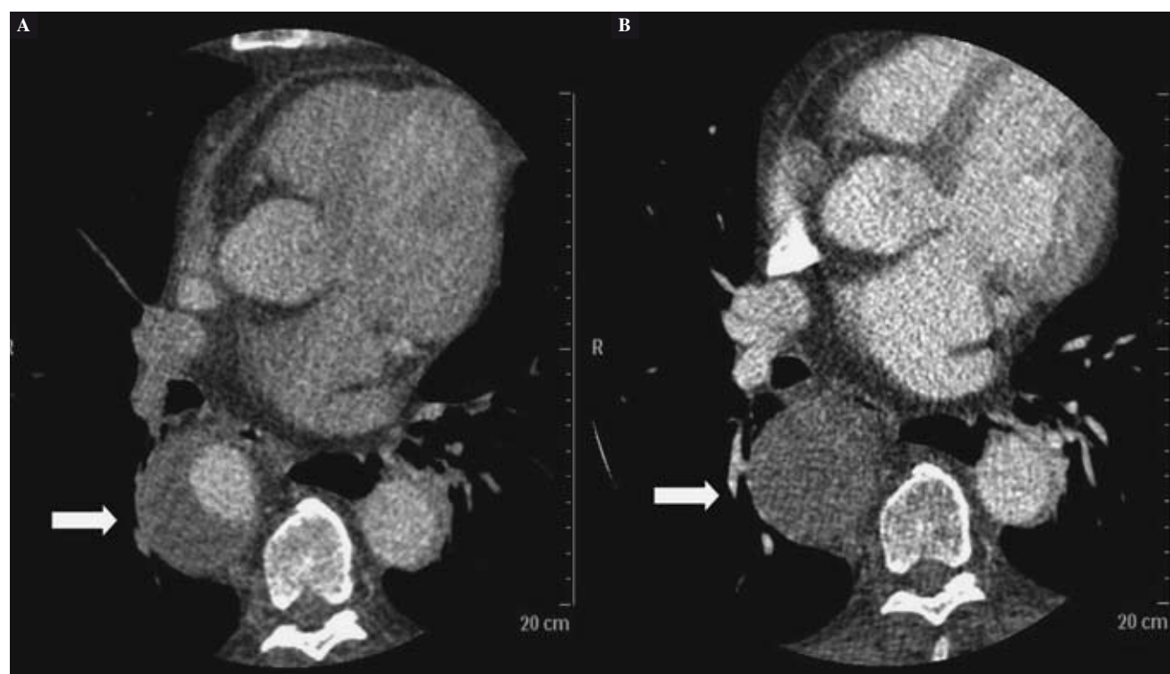
Figura 3. Controles tomográficos postoperatorios a los 6 meses (A) y al año (B), que evidencian una reducción progresiva del flujo sanguíneo en el saco aneurismático.

reconstrucción extraanatómica con exclusión del saco aneurismático. El tiempo de CEC fue 203 min y de parada circulatoria 35 min. En el postoperatorio el paciente precisó ventilación mecánica prolongada (tiempo total: 72 h) y posterior ventilación con presión positiva incruenta (CPAP) durante 5 días, por disfunción respiratoria (elevado gradiente alveoloarterial [ \text{PaO}_2/\text{FiO}_2 \leq 200 ], en posible relación con la manipulación intraoperatoria del pulmón izquierdo y, de forma global, como síndrome de respuesta inflamatoria sistémica post-CEC). El paciente presentó agitación y bradipsiquia inicial tras retirada de sedación, con tomografía axial computarizada cerebral sin hallazgos patológicos completamente resueltos en las primeras horas. Fue dado de alta a los 26 días de la intervención. Los controles postoperatorios con tomografía axial computarizada (a los 3 y 6 meses postoperatorios y, posteriormente, al año) mostraron normofuncionalidad de la prótesis tubular, discreta regresión de los diámetros (diámetro máximo de 60-57 mm) y reducción progresiva del flujo sanguíneo colateral en el saco aneurismático (Fig. 3).