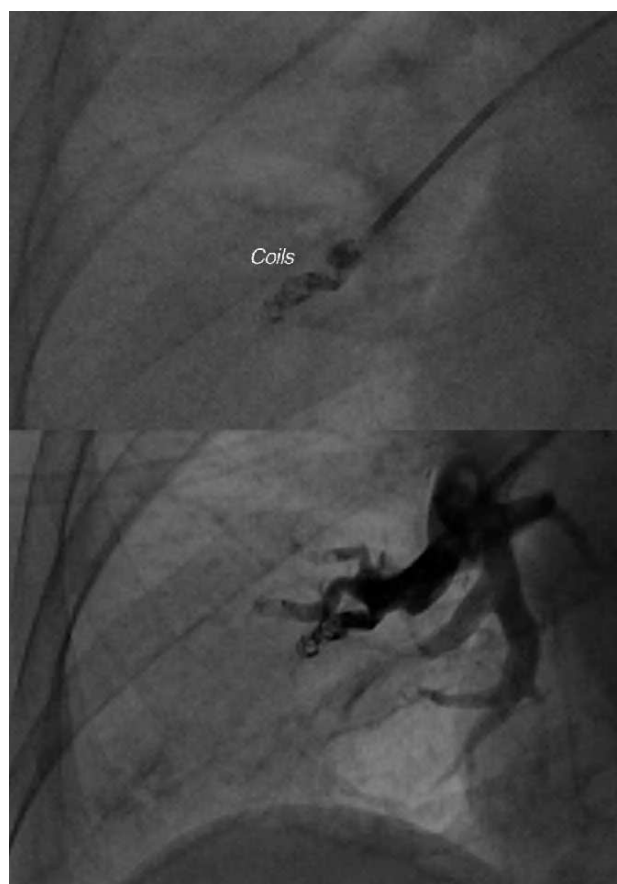
Fig. 2. Coils en rama arterial pulmonar con ausencia de paso de contraste.

Sección de Hemodinámica. Servicio de Cardiología. Complejo Hospitalario Universitario de Albacete. Albacete. España.