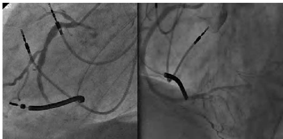
Fig. 1. CD obstruida en el segmento distal (izquierda). Resultado de la angioplastia a CD tras implantación de 2 stent Xcience en CD distal y stent Cypher en CD media con inversión de las colaterales hacia la Cx (derecha).

el interior del catéter guía de la CD. Al estar usando un catéter guía de 100 cm (que por su longitud impide llegar con el balón retrógradamente a la zona obstruida), se captura la guía mediante una guía-lazo (Amplatz goose neck, EV3) introducida por el catéter de la CD. Se intenta exteriorizar la guía tirando con el lazo por el catéter guía de la CD, teniendo que realizar mucha fuerza, y se produjo intubación profunda de la coronaria izquierda. Se decide fijar la guía con el lazo, y se consigue soporte suficiente para avanzar el microcatéter retrógradamente hasta el catéter guía de 5 Fr de la CD (fig. 2). A continuación, se pasa una guía BMW (Abbott Laboratorios) desde la CD proximal introduciéndola en el microcatéter. Se avanza la guía hasta la rama septal por el microcatéter y posteriormente se lo retira dejando la guía en la DP distal. Se dilata con balón Avion OTW 1,25-14 la obstrucción de la CD distal. Se realizan varios inflados a lo largo de la CD distal y la DP, y se comprueba oclusión de la posterolateral (PL). Se logra pasar una guía Whisper a la PL y se dilata con balón