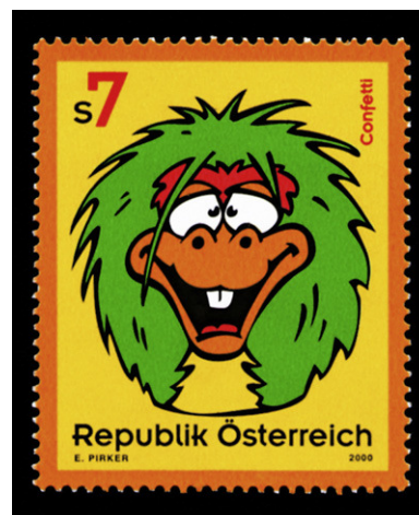
Figura 1 – Austria, 2000 – Yvert, 2142.