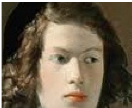
Figura 2 – Telecanto del joven protagonista.

vieja zíngara al ser pagada por su profecía o lectura de la mano.