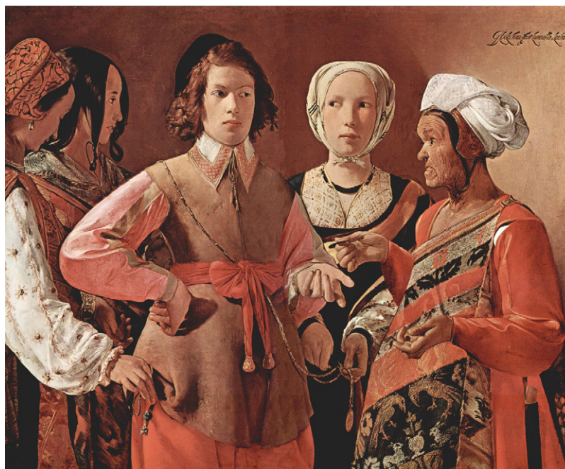
Figura 1 – La buenaventura.

La obra representa una escena picaresca del siglo XVII: un joven ricamente vestido está siendo robado por cuatro astutas ladronas. La víctima escucha el reproche de la