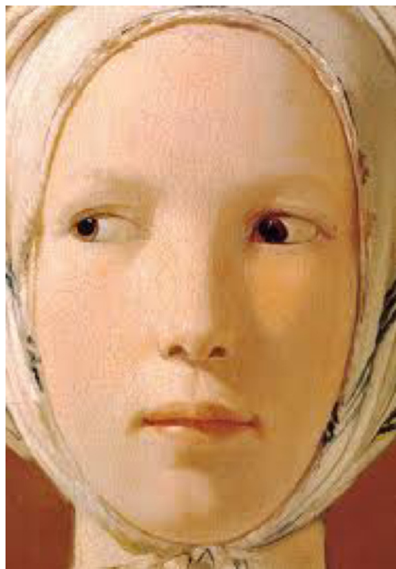
Figura 3 – Telecanto evidente de una de las ladronas.

El telecanto consiste en el aumento de la distancia entre los cantos internos debido a la excesiva longitud de los tendones del canto interno. Debe tenerse en cuenta en el diagnóstico diferencial del estrabismo, además del epicantus, sobre todo en los niños. No debe confundirse con el hipertelorismo, en el que existe una gran separación entre las órbitas.