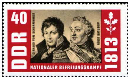
Figura 4 – Alemania Oriental (DDR) 1963/Yvert 6989 de 694/98, con el general prusiano Gerhard von Scharnorst.

Rusia ha emitido varios sellos dedicados a Kutúzov: en 1945, bicentenario de su nacimiento; en 1962, sesquicentenario de la batalla de 1812 (batalla de Borodino contra las tropas napoleónicas), y en 1995 recordando los 250 años de su nacimiento. Los correos de la Alemania Democrática emitieron en 1963 una serie de cinco sellos para conmemorar el sesquicentenario de la liberación alemana en 1813 por la victoria sobre los ejércitos franceses ( figs. 1-4 ).