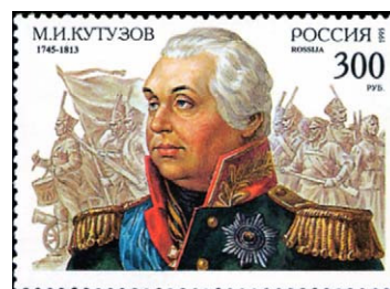
Figura 3 – Rusia 1995/Yvert 6099.