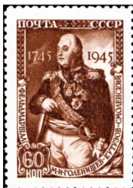
Figura 1 – Rusia 1945/Yvert 997 de 996/97. Ambos sellos con idéntica imagen.

Al morir Kutúzov sin hijos varones, ordenó en su testamento que sus bienes pasaran a la familia de Lev Tolstói quien, a su vez, recordó a Kutúzov en su novela Guerra y Paz.