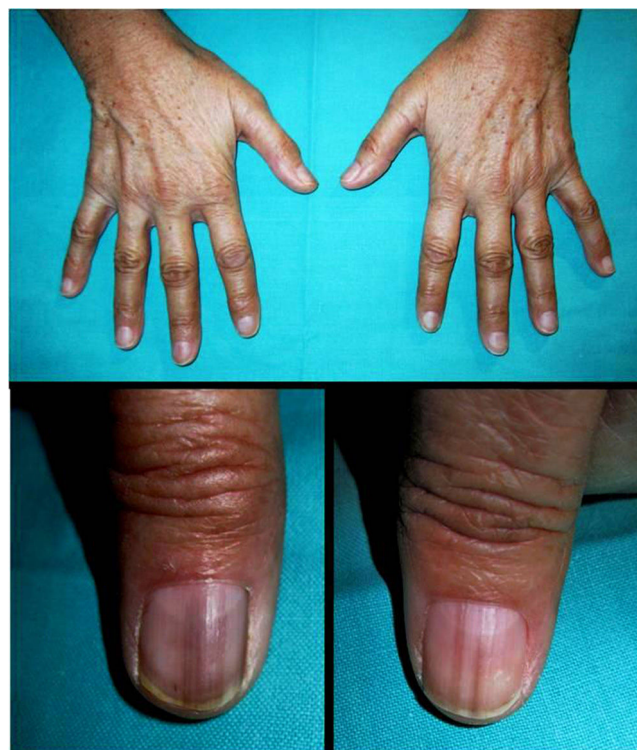
Figura 1 Hiperpigmentación cutánea. Líneas y bandas longitudinales hiperpigmentadas en las uñas de los primeros dedos de ambas manos.

La hiperpigmentación cutánea asociada a la enfermedad de Addison se caracteriza por un bronceado extenso de la piel fotoexpuesta y en menor medida de la no expuesta por estímulo de la ACTH y la MSH. A nivel de la uña dicho