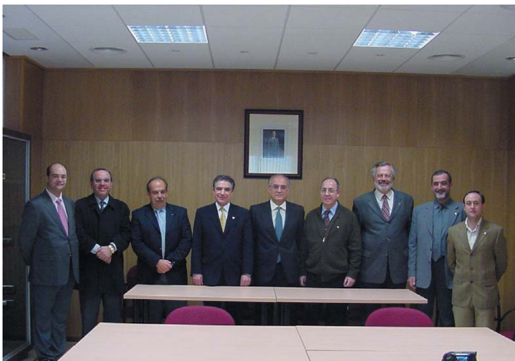
Reunión de la Asociación Española de Fisioterapeutas con el Colegio Profesional de Fisioterapeutas de Andalucía celebrada en Sevilla.