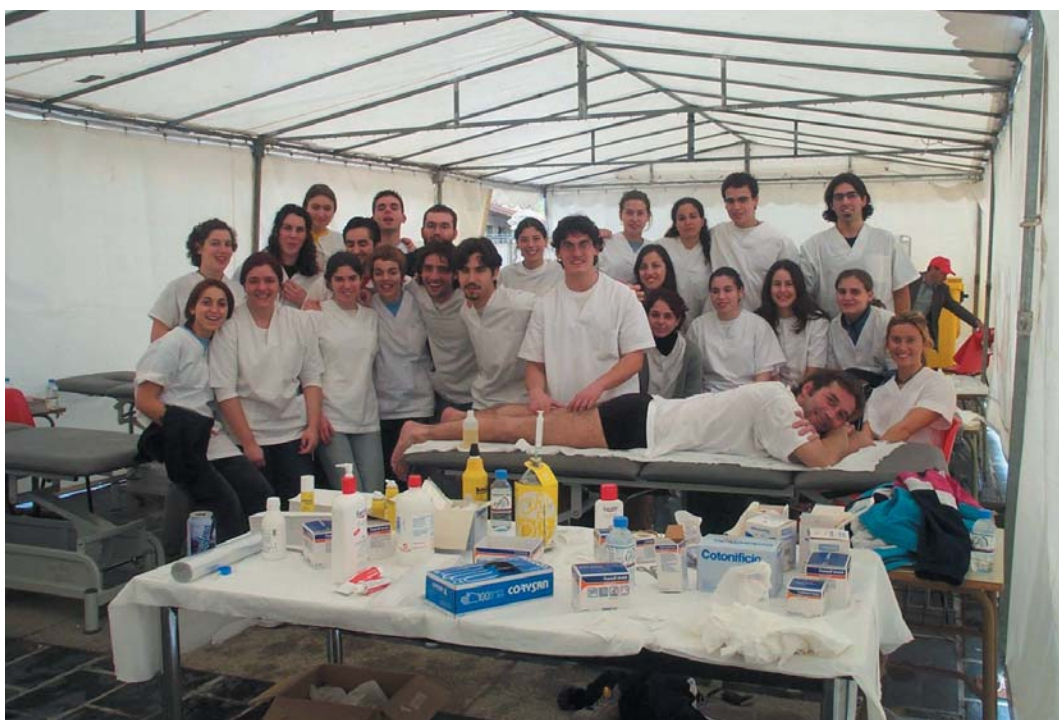
Tercer medio maratón Vig-Bay en el que colaboró la Escuela Universitaria de Fisioterapia de Pontevedra aportando dos unidades, una a la salida y otra a la llegada de la medio maratón del 10 de febrero.