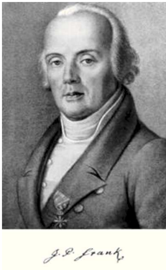
Figura 1. Johann Peter Frank, (1745-1821).

reseñados en el sitio web de la Sociedad Johann Peter Frank en Alemania, 1 sólo se inscribe el libro de historia de la medicina de Francisco Guerra, (1985). Un notable registro de la vida y obra de Frank se encuentra en la serie de conferencias dictadas en la Universidad de Londres en 1956 por el filólogo e historiador médico franco-suizo Henry E. Sigerist (1891-1957), publicadas originalmente como "Landmarks in the history of Hygiene" (Oxford University Press) y en español como "Hitos en la historia de la salud pública" por la editorial Siglo XXI. 2 Actualmente, el contenido de esta conferencia de Sigerist "Johann Peter Frank: un pionero de la medicina social" se encuentra también disponible a través de su publicación en la revista "Salud Colectiva" de la Universidad de Lanus, Argentina 3 en su página de internet. En su resumen, esta última publicación alude el hecho de que la labor precursora de Frank en el campo de la medicina social fue revalorada con esta intervención de Sigerist. Aun así, el conocimiento en general sobre Frank y su trabajo, es fragmentario. En su tratado "Un sistema completo para una policía médica" , Frank conjuntó las ideas