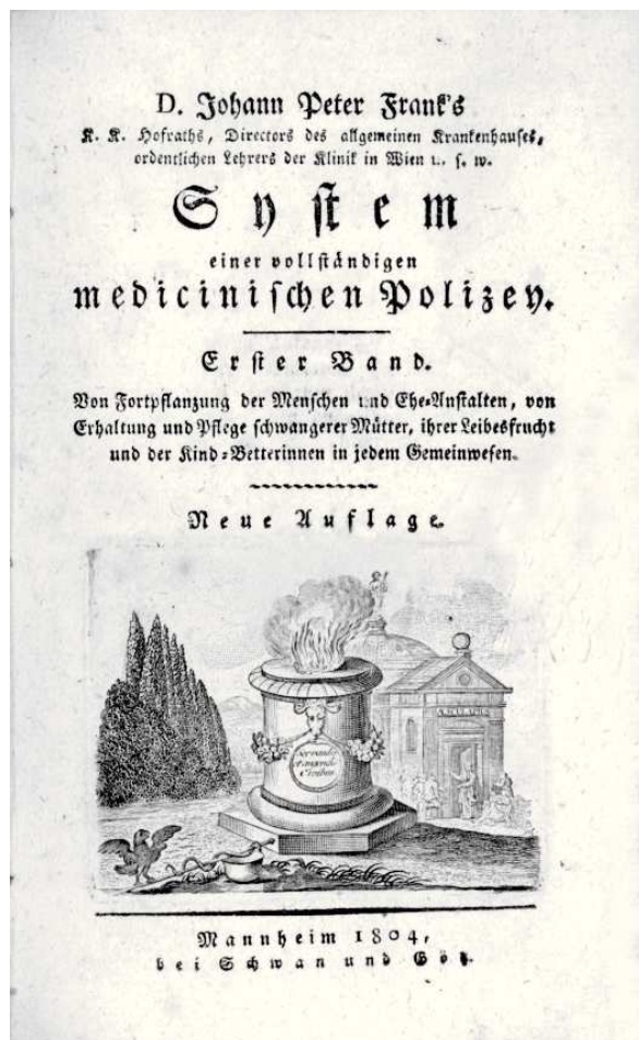
Figura 2. La mayor obra de Frank: Un sistema completo para una policía médica.

po asimismo sufrió la muerte de su esposa por fiebre puerperal. Después de diferentes estancias en el Palatino y como médico de la corte en la residencia del Marqués de Rastatt, se le nombró en 1772 médico de cabecera del arzobispo de Espira (Speyer), lugar donde permaneció 12 años. Durante ese tiempo, inició el período de maduración y el transformar en acción las ideas que concibió durante sus estudios médicos, para poner los servicios médicos al servicio del pueblo a través de la ayuda y apoyo de la fuerza del estado. 6 Construyó una escuela de parteras, fundó dos hospitales y una cátedra quirúrgica. 7 A consecuencia de ello, la mortalidad materna en el (príncipe-) arzobispado disminuyó considerablemente y la población se benefició asimismo con los cuidados y presencia de los cirujanos. De la misma manera, Frank