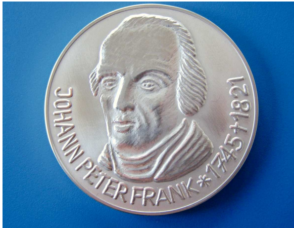
Figura 4. La Medalla Johann Peter Frank

de enfermedades. Entre otras acciones, acompañaron la introducción en Alemania del seguro obligatorio de enfermedad en 1883 y el seguro de accidentes en 1884 por Otto von Bismarck, así como el desarrollo y establecimiento de los Ministerios de Salud en las Comunas (municipios) en las primeras décadas del siglo XX. Durante el oscuro período del Nacional-socialismo alemán, estas mismas instituciones fueron puestas al servicio de la “higiene racial” a partir de 1933, con la Ley de Prevención de la descendencia genéticamente enferma. Las ideas de Frank acerca de la responsabilidad estatal por la salud de los ciudadanos, en el sentido “patriarcal” de apoyar los reglamentos y el cuidado por el estado, fueron reinterpretadas y tergiversadas. Así, en lugar de la higiene social, se impuso la “higiene racial”. 13 Esta inferencia falaz de las ideas de Frank con fines de justificación pseudocientífica de las ideas racistas nazis 14 es todavía una fuente de controversia entre los estudiosos e historiadores de ese régimen nefasto.