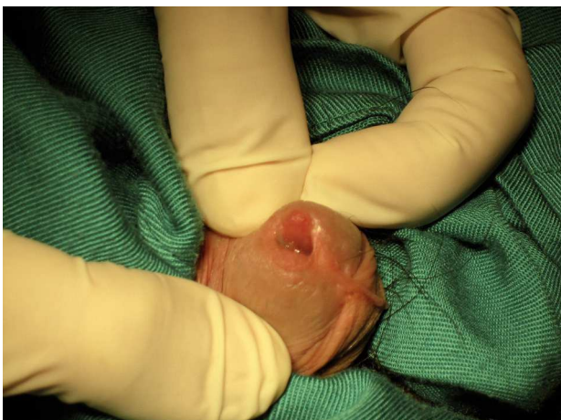
FIGURA 1. Pólipo fibroepitelial (talla verde).