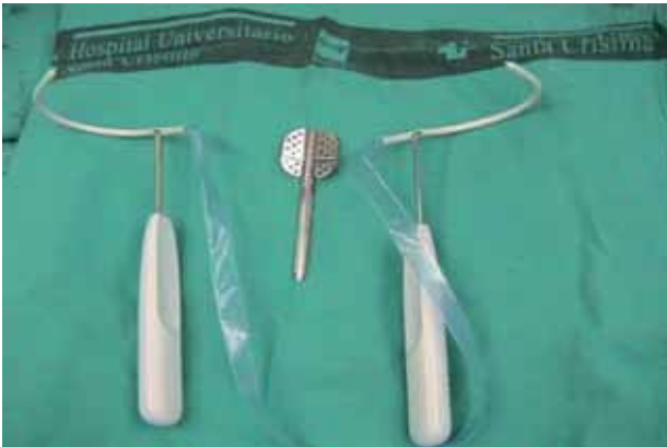
FIGURA 1. Dispositivo Ginecare TVT Obturador System.

- Una guía con aletas atraumáticas, de acero inoxidable, que facilita el pasaje de los pasadores helicoidales por el área de disección.