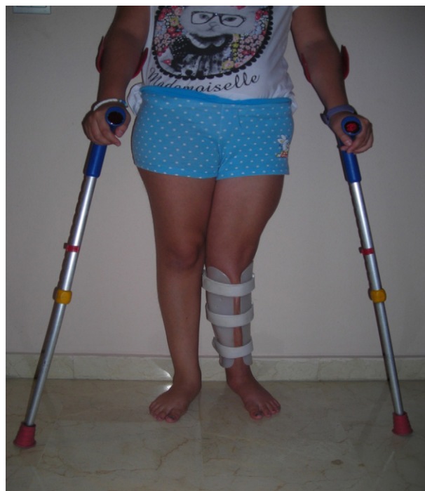
Figura 2 Reeducción de la marcha en 3 puntos. Fase posterior a la consolidación ósea.

La interpretación de los resultados en relación con la amplitud articular y el tono de la musculatura afectada (tabla 1) aporta un aumento del rango articular en la flexión de rodilla, logrando tras 8 semanas de tratamiento una flexión activa de 120°. En cuanto al tono muscular y el dolor percibido, también observamos una mejora global, fundamentalmente en cuádriceps e isquiotibiales. Un estudio similar al nuestro fue el realizado por Barker et al 16 , que analizan la recuperación en amplitud y fuerza muscular del miembro intervenido antes del alargamiento óseo y a los 6, 12 y 24 meses después de la intervención. Su estudio revela una disminución de la fuerza muscular del cuádriceps tras los 24 meses de la intervención, algo que difiere de nuestro estudio, ya que nuestra paciente presenta disminución de la fuerza muscular, pero en los isquiotibiales. Los autores de este trabajo consideran que pueda deberse a que se están estableciendo comparaciones