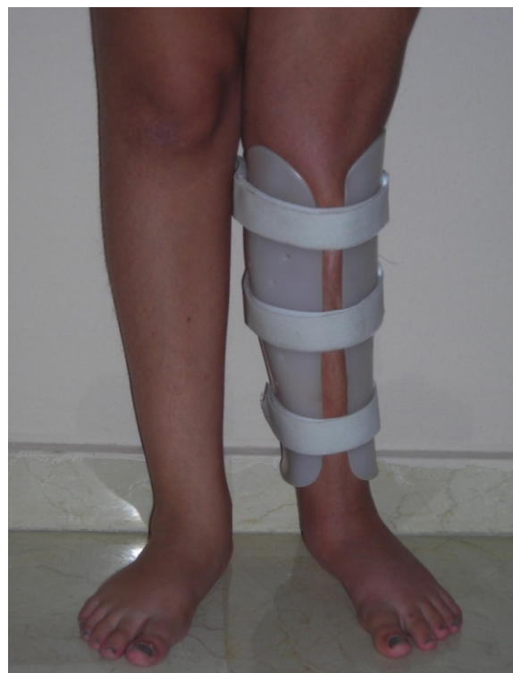
Figura 3 Uso de férula correctora antivalguzante en el apoyo.

entre estudios metodológicamente heterogéneos. En relación con la amplitud articular, al igual que Barker et al 17 , nuestros esfuerzos durante el tratamiento se centraron en acelerar la recuperación de la movilidad articular de la rodilla, logrando 120° al final de los 9 meses de tratamiento.