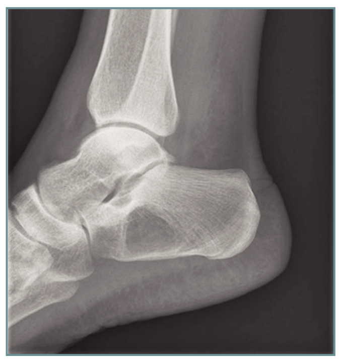
Figura 1. Rx. Se observa una lesión lítica bien definida a nivel del triángulo de Ravelli en la Rx lateral del tobillo realizada en urgencias. En este caso no existen calcificaciones, perteneciendo a un grado 1 de Millgram.