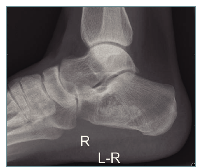
Figura 7. Consolidación ósea con integración del injerto, observándose la continuidad de las trabéculas óseas a las 14 semanas de la intervención.