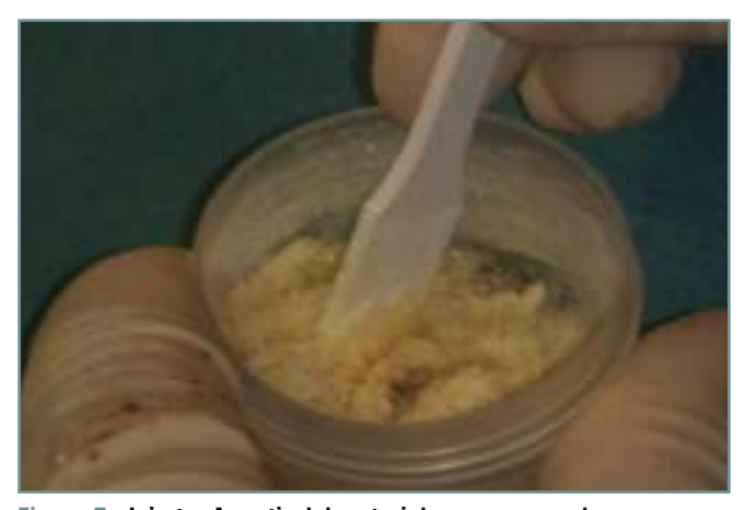
Figura 5. Injerto. A partir del material seco se mezcla con sangre o suero para crear una masa moldeable, que permite rellenar o adquirir la forma de características de manejo que sea necesaria.