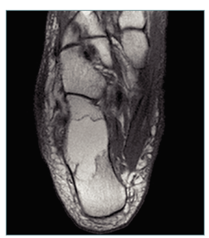
Figura 2. Cortes axiales de RMN, en T2, diagnósticas de lipoma intraóseo de calcáneo.

La serie que presentamos llama la atención en cuanto al escaso periodo de recopilación de los pacientes (15 meses). Vilá et