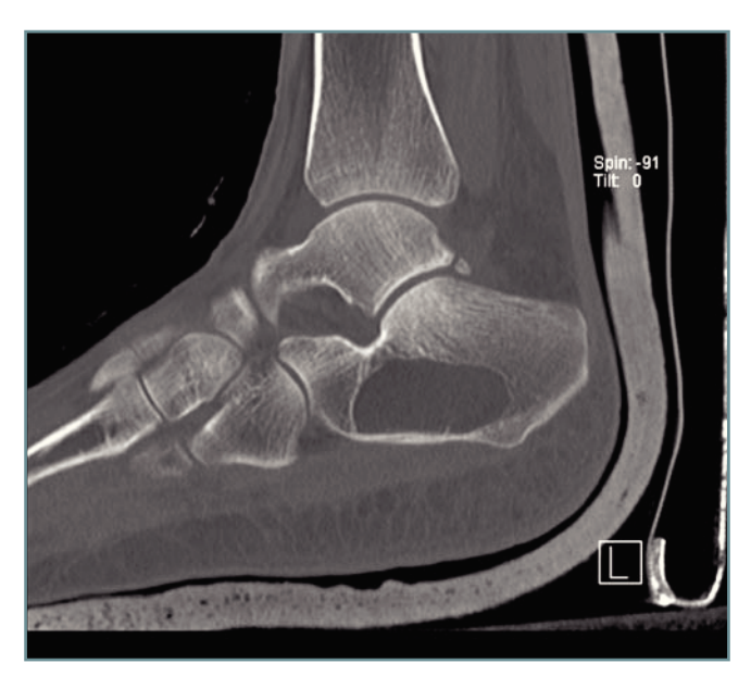
Figura 3. Imagen de TAC en la que se observa la gran lesión lítica con escasas trabéculas óseas.